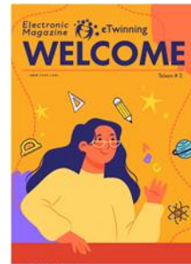
Περιοδικό eTwinning 2ο Τεύχος περιοδικού eTwinning