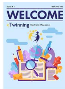
Περιοδικό eTwinning 1ο Τεύχος περιοδικού eTwinning

Επαγγελματίες και ενδιαφερόμενους στο χώρο της εκπαίδευσης.